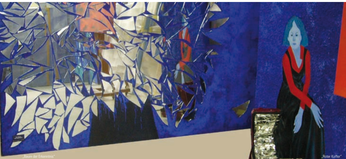
„Baum der Erkenntnis“